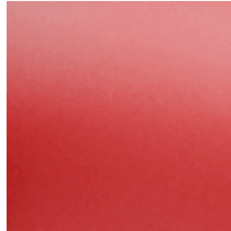
Magma Red (719)