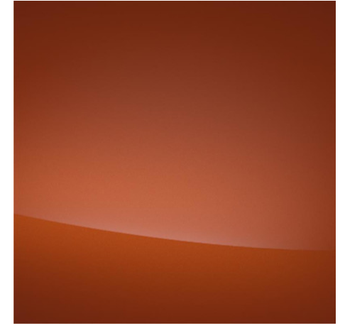
Brown Terracotta (CNZ)