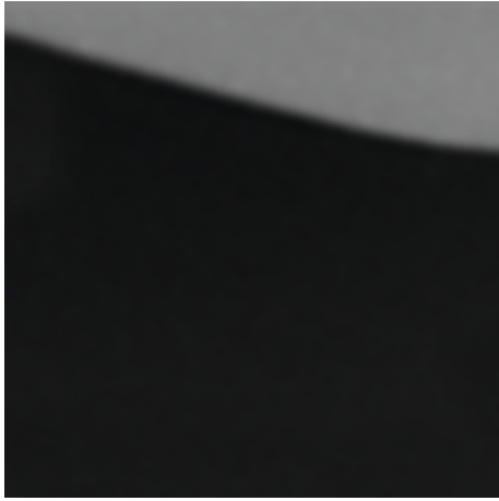
Mystery Black (GNE)