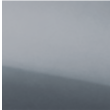
Urban Grey (KPW)