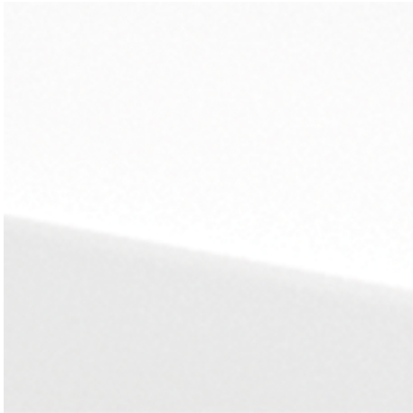
Mineral White (QNG)