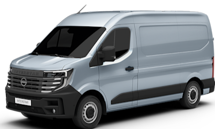
Star Grey Metallic (KNH)