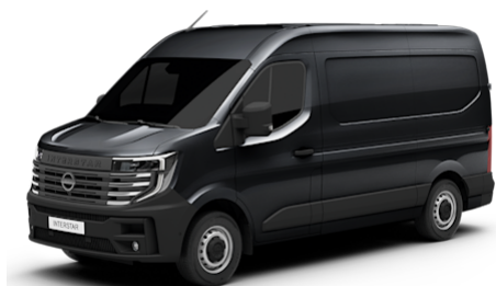
Black Pearl Metallic (676)