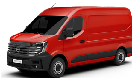
Fire Red (071)