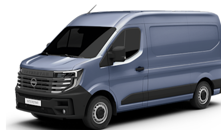
Blue Grey Metallic (J47)