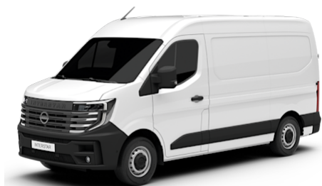
Mineral White (QNG)