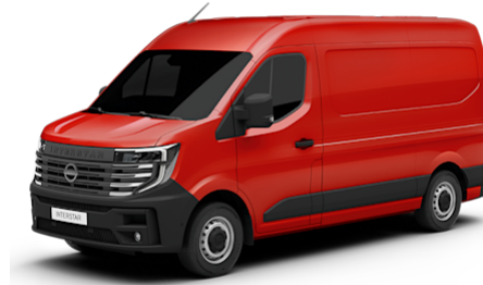
Fire Red (071)