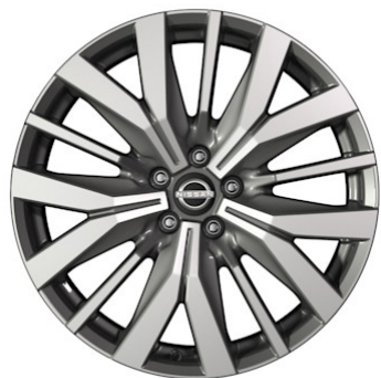
Opzionale per Tekna+ Cerchi in lega da 20" argento diamantati (255/45 R20)