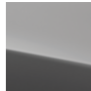
Dark Grey Metallic (KAD)