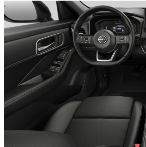
Tekna Sedili in similpelle nero