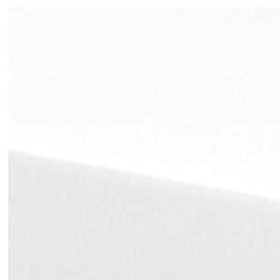
Arctic White Pearl (QBE)