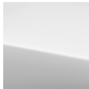
Bright Silver Metallic (K23)