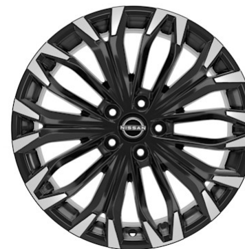
TEKNA, TEKNA+ Cerchi in lega da 19" neri multirazze (235/55 R19)