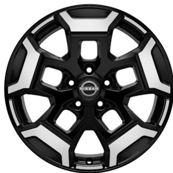
N-Trek Cerchi in lega da 18" AUTECH® (235/60 R18)