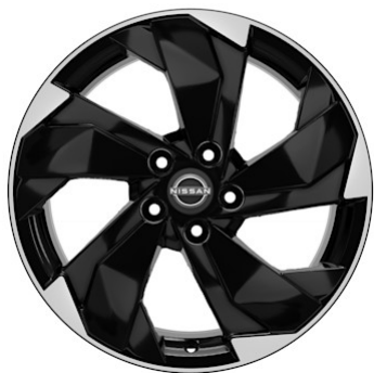
N-Connecta Cerchi in lega da 18" neri (235/60 R18)