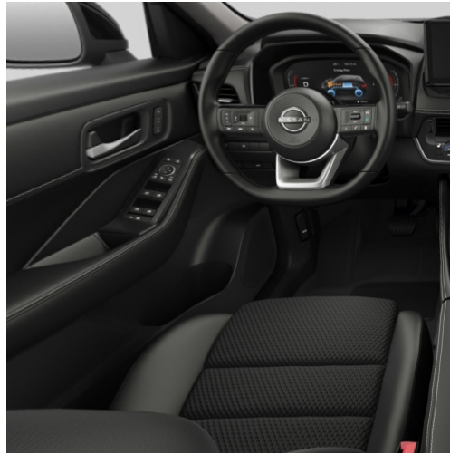
N-Trek AUTECH® rivestimenti dei sedili impermeabili (Cellcross)