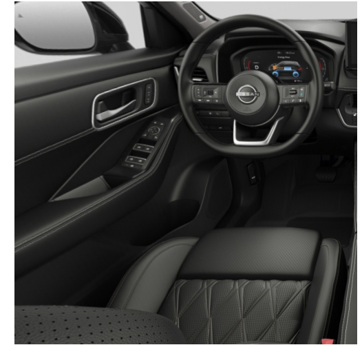
Tekna+ Sedili in pelle premium trapuntata, neri