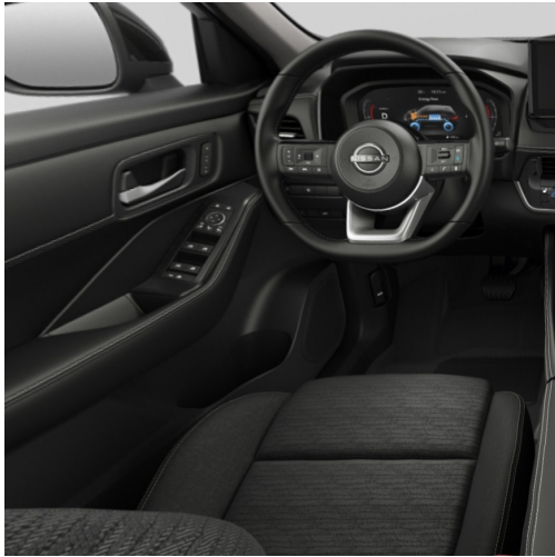
N-Connecta Sedili in tessuto nero