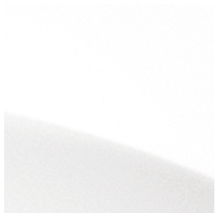
Crystal White Solid (QAK)