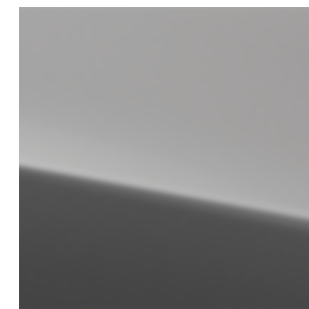
Dark Grey Metallic (KAD)