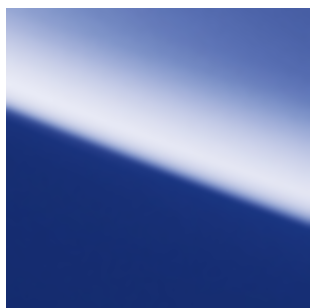
Electric Blue Metallic (RBY)