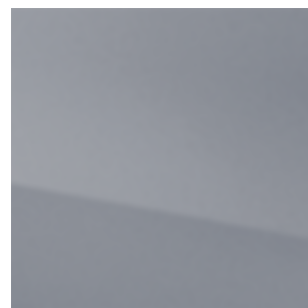
Ceramic Grey Pearl (KBY)