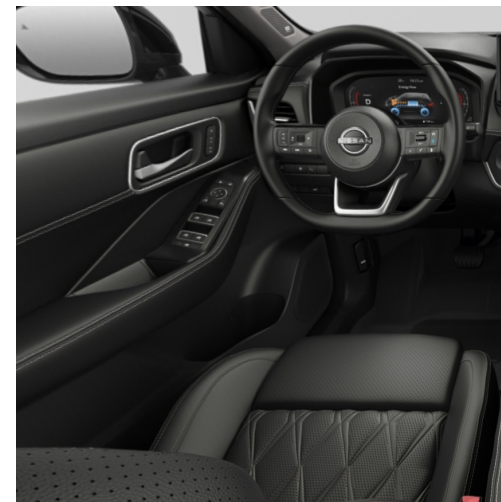
Tekna+ Sièges en cuir premium matelassé, noirs