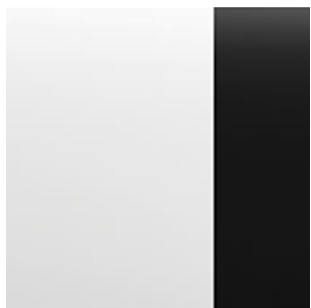
Arctic White Pearl + Black Roof (XKJ)