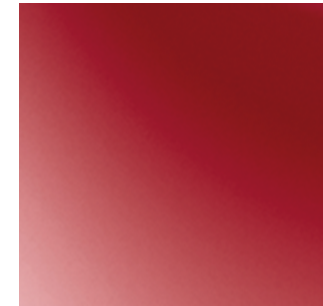
Tinted Red Pearl (NBL)