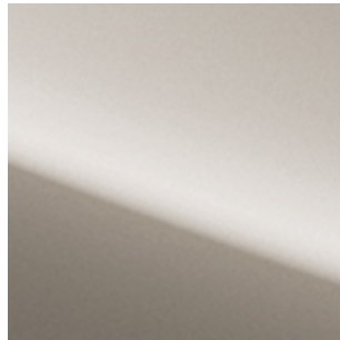
Champagne Silver (KAY)