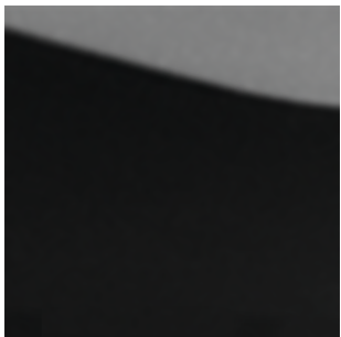
Diamond Black (G41)