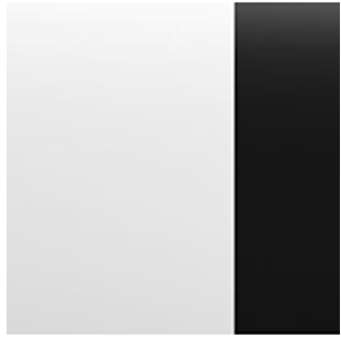
Arctic White Pearl + Black Roof (XKJ)