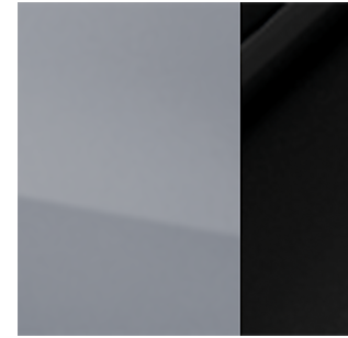
Ceramic Grey Pearl + Black Roof (XEX)