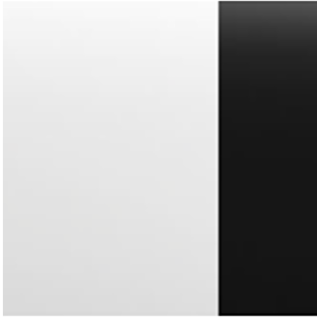
Pearl White + Black Roof (XKJ)