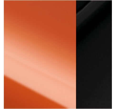
Orange + Black Roof (XEV)