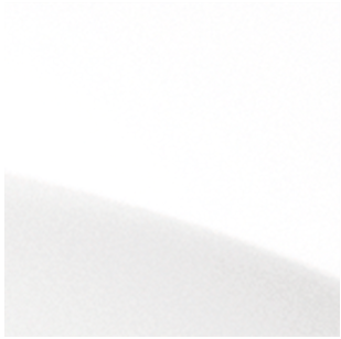
Crystal White Solid (QAK)