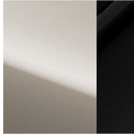
Champagne Silver + Black Roof (XEW)