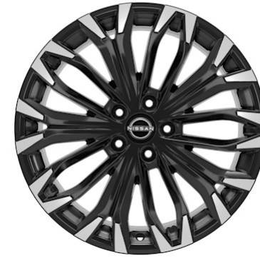
TEKNA, TEKNA+ 19"-Leichtmetallfelgen schwarz mehrspeichig (235/55 R19)