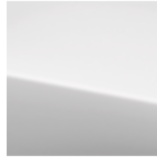
Bright Silver Metallic (K23)