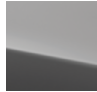
Dark Grey Metallic (KAD)