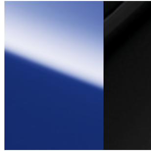
Electric Blue Metallic + Black Roof (XEU)