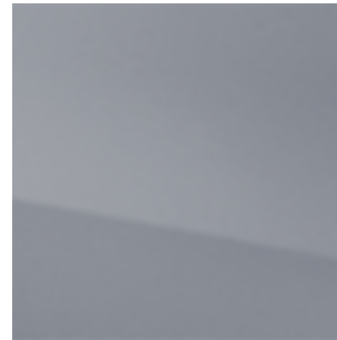
Ceramic Grey (KBY)