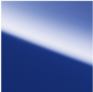
Electric Blue Metallic (RBY)