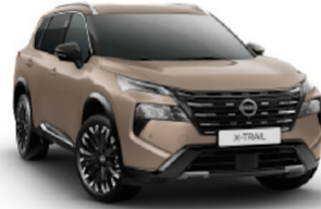
Dark Beige (HAL)