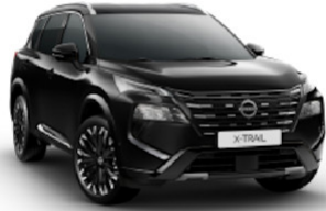
Diamond Black (G41)