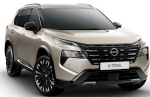
Champagne Silver (KAY)