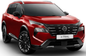
Tinted Red (NBL)