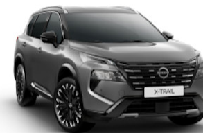
Ceramic Grey (KBY) / Black (KH3)