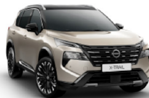
Champagne Silver (KAY) / Black (KH3)