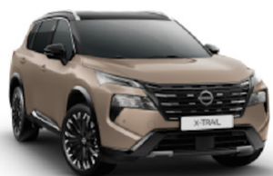
Dark Beige (HAL) / Black (KH3)