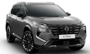
Dark Grey (KAD)