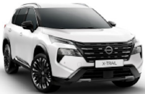
Pearl White (QBE)