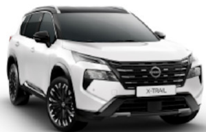
Pearl White (QBE) / Black (KH3)