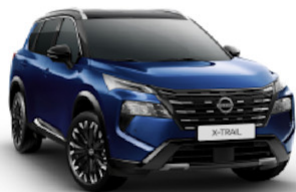
Blue (RCJ) / Black (KH3)