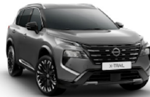
Ceramic Grey (KBY)