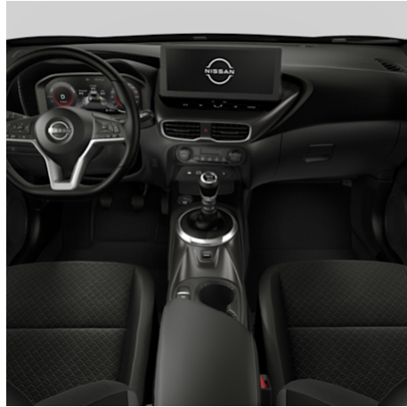
N-CONNECTA Stoff / Ledernachbildung Schwarz