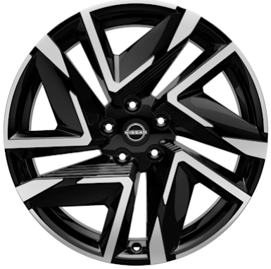
N-Design 19" Leichtmetallfelgen glanzgedreht (225/45 R19)