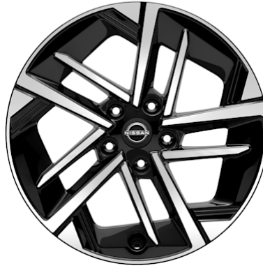
N-Connecta 17" Leichtmetallfelgen glanzgedreht (215/60 R17)