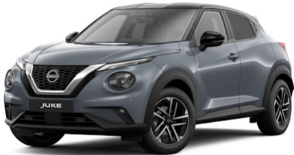
Ceramic Grey KBY / Glossy Black XEX