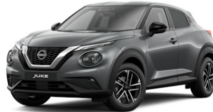
Dark Grey KAD