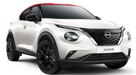
Sonderedition REDLINE Pearl White YDA / Fuji Sunset Red auch verfügbar in Ceramic Grey YAV / Fuji Sunset Red