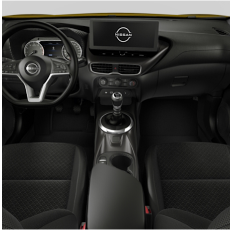
ACENTA Stoff Schwarz