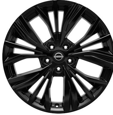
N-Sport 19" Leichtmetallfelgen „Akari“ (225/45 R19)