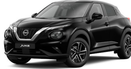
Pearl Black GAT