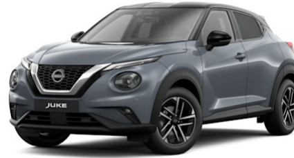
Dark Grey KAD / Glossy Black GAQ