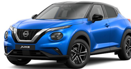
Magnetic Blue RCF / Glossy Black XGZ