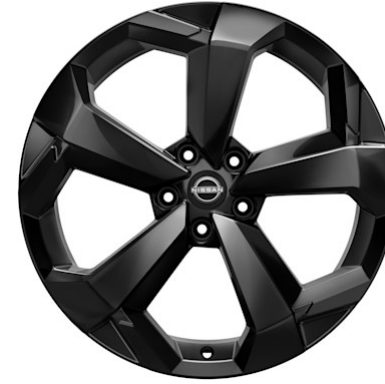
Tekna 19"-Leichtmetallfelgen (225/45 R19)