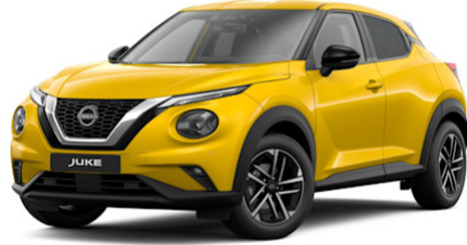
Iconic Yellow ECE