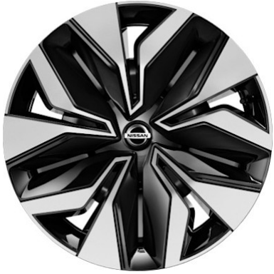
Acenta 17" Stahlfelgen mit Radabdeckung „Sakura“ (215/60 R17)