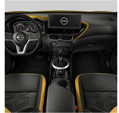
N-SPORT Ledernachbildung Schwarz mit gelben Alcantara- Akzenten