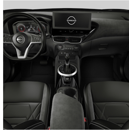
N-DESIGN Leder / Alcantara Schwarz