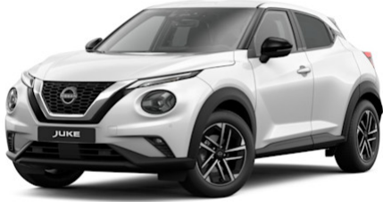
Solid White 326