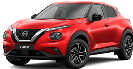
Fuji Sunset Red NBV