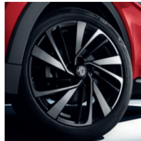
Luxury Cerchi in lega da 18" 225/55R18