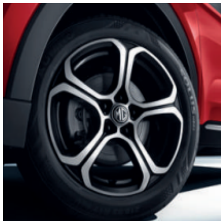
Comfort Cerchi in lega da 17" 215/55R17