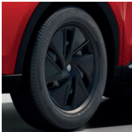
Standard Jantes en acier de 16" 215/60 R16