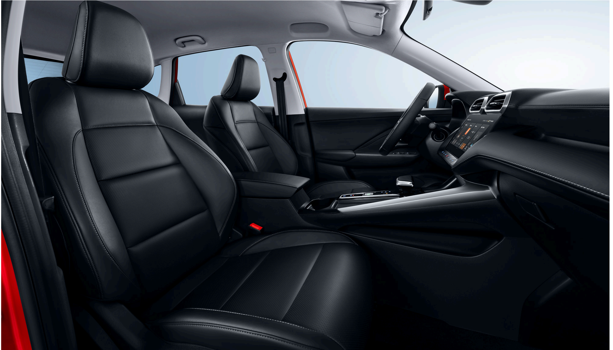
Abbildung: Interieur MG ZS Hybrid+ Luxury