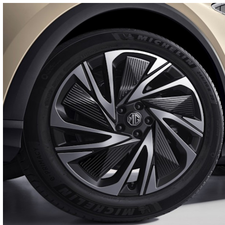
Luxury Cerchi in lega da 20" 245/50R20