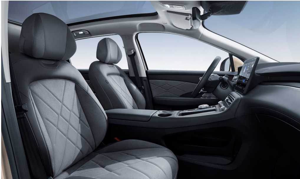
Sitze in grauem Leder- und Wildlederoptik mit Karbon-Effekt-Zierleisten