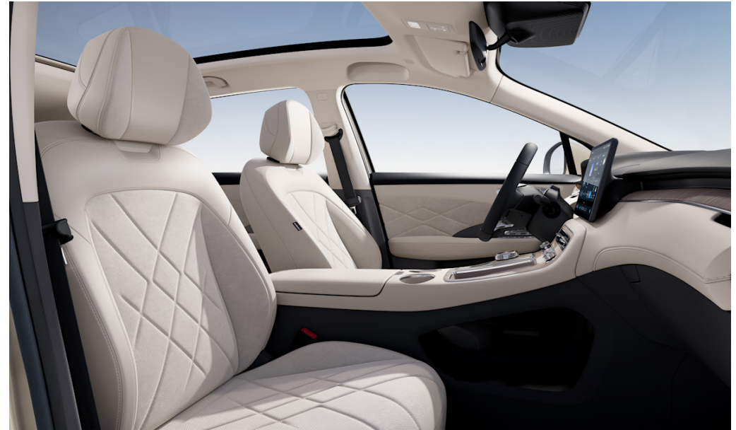
Sitze in beiger Leder- und Wildlederoptik mit naturgetreuen Zierleisten