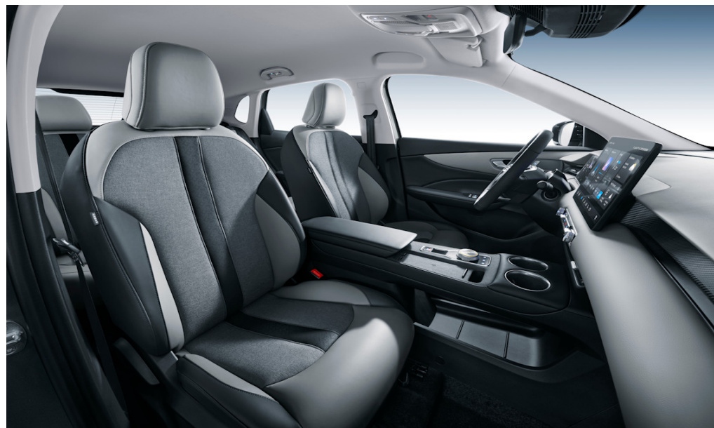
Sedili in similpelle nero/grigio con inserti in tessuto