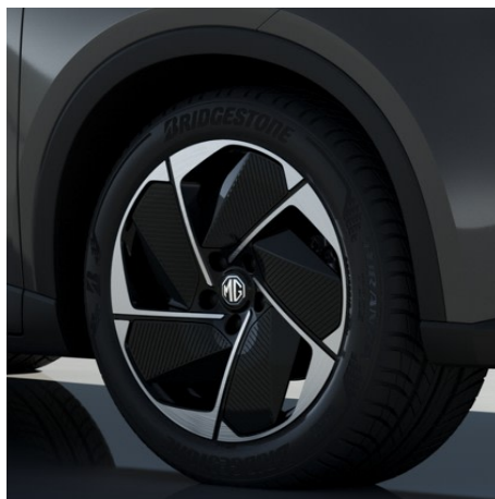
Luxury Cerchi in lega da 18" 225/55R18