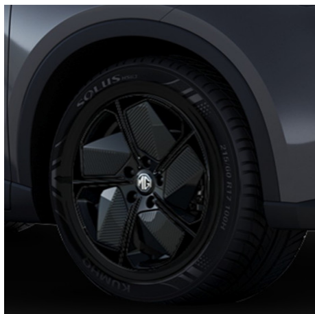
Comfort Cerchi in lega da 17" 215/60R17