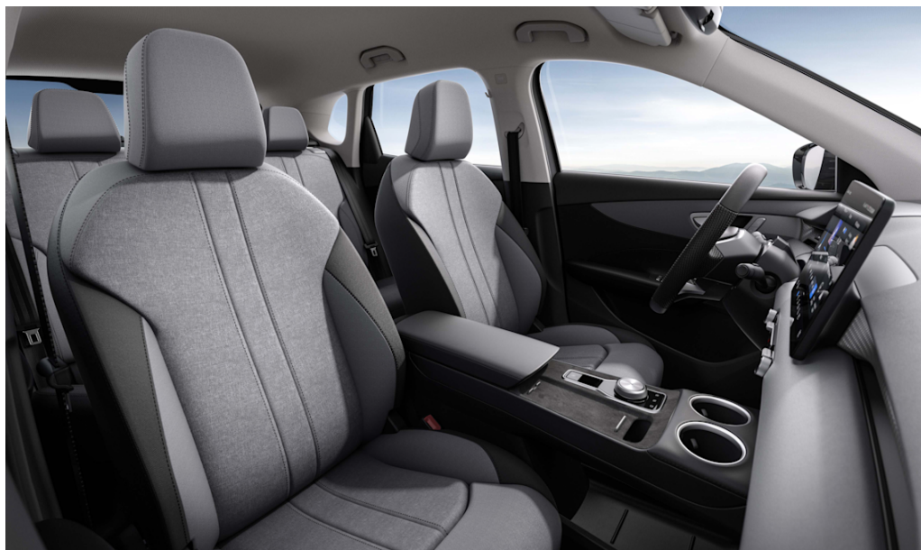
Sedili in tessuto nero/grigio