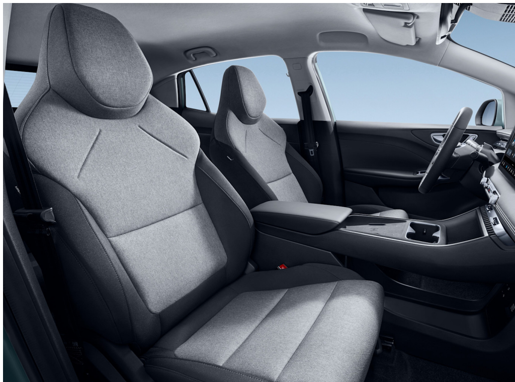
Sedili in tessuto nero/grigio