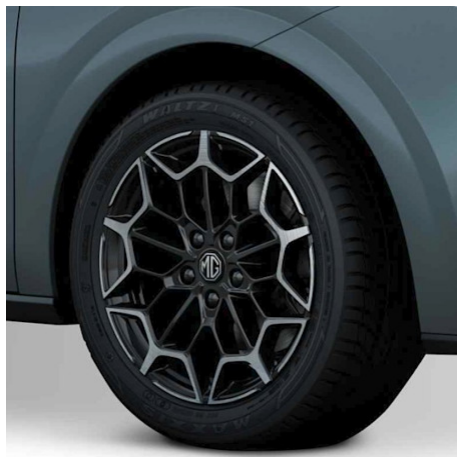
Premium Cerchi in lega da 17" 205/50R17