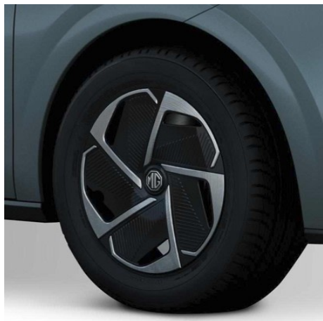
Comfort Cerchi in lega da 16" 195/60R16