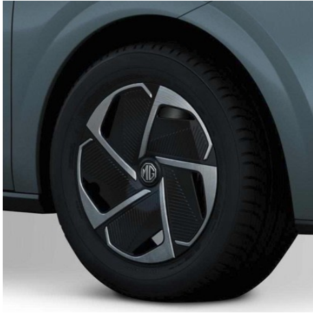
Comfort 16"-Leichtmetallfelgen 195/60R16