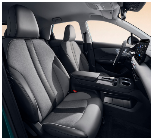
Sedili in similpelle nero con inserti in tessuto