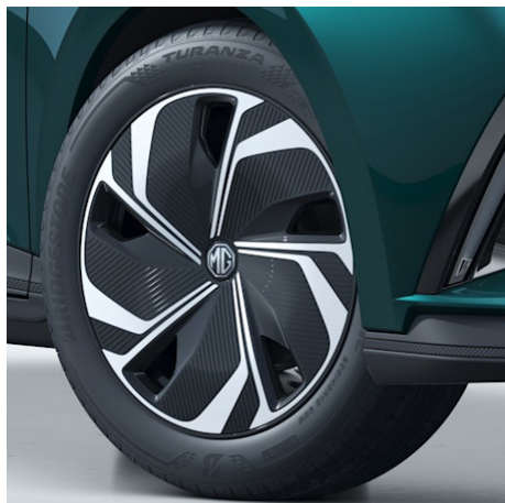
Premium Cerchi in lega da 18" 235/45R18