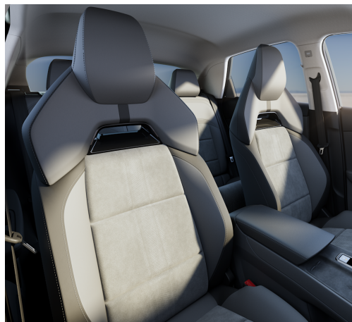
Sedili sportivi in pelle scamosciata grigio chiaro con poggiatesta integrati