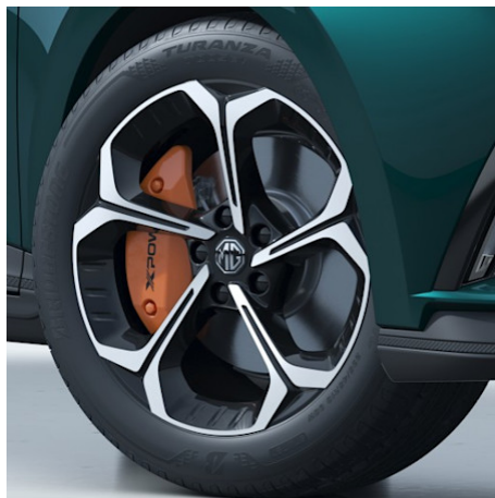
XPOWER Cerchi in lega da 18" con pinze dei freni arancioni 235/45R18