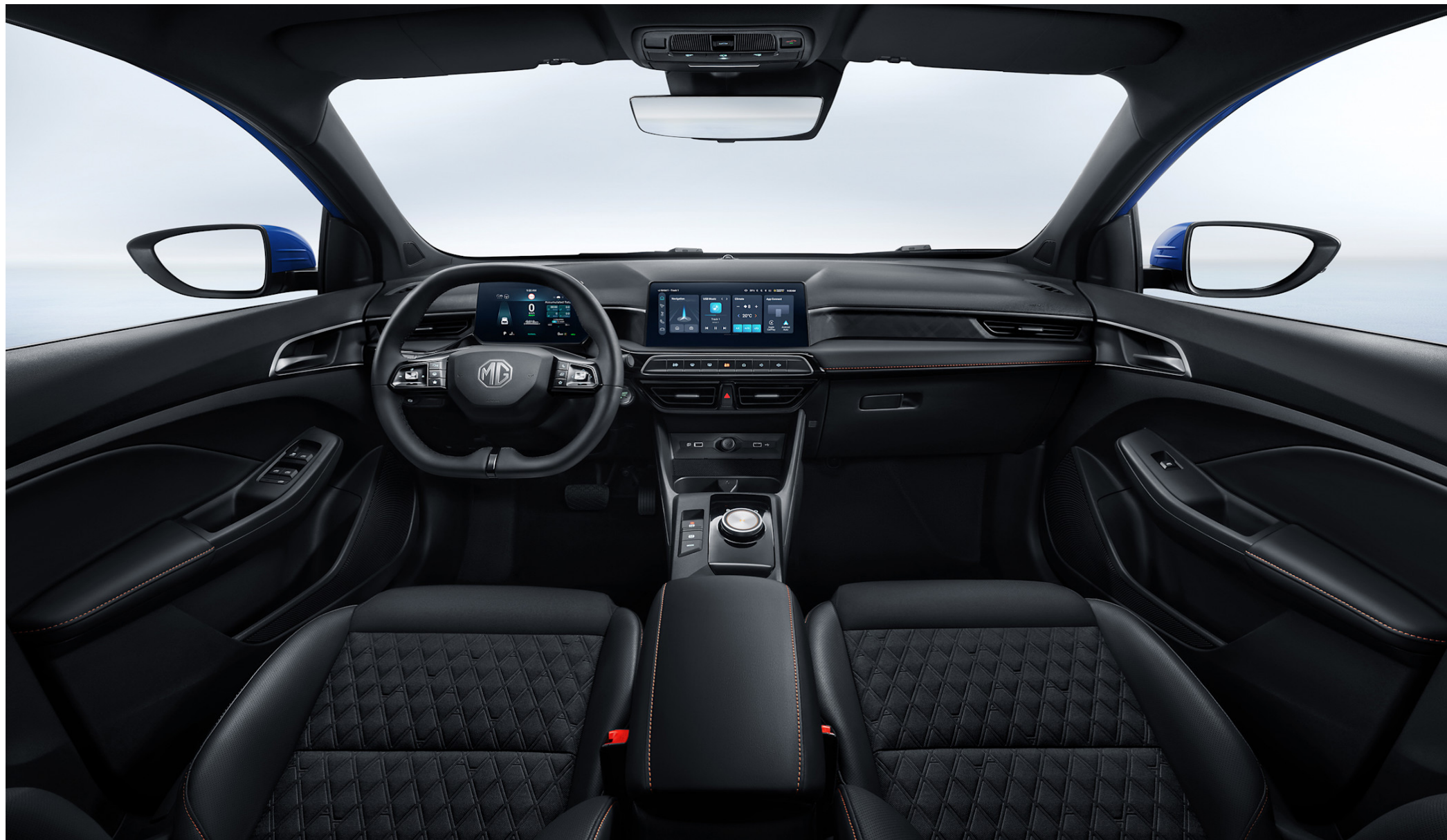
Immagine: Interni MG3 Hybrid+ Luxury