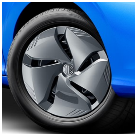
Standard Acciaio 15 185/65R15