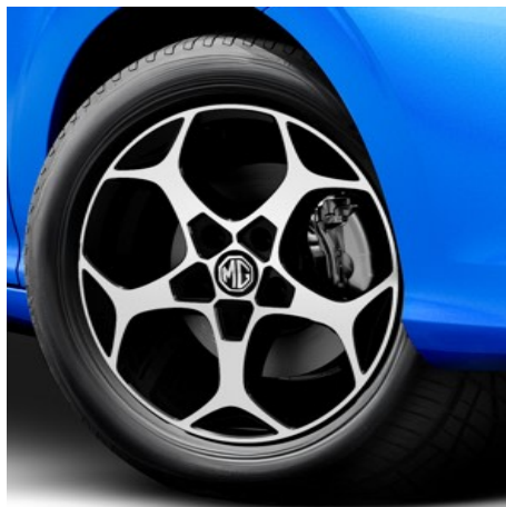
Comfort & Luxury Cerchi in lega leggera da 16" 195/55R16