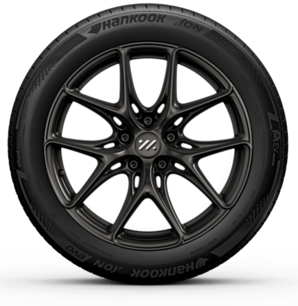
Long Range & Performance 20" Lightweight Wheels Vorne: 235/50R20 Hinten: 255/45R20