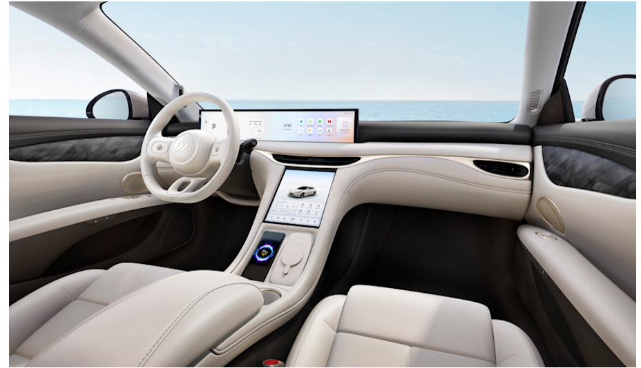
Ultrasofte Sitze in Lederoptik – Weiss