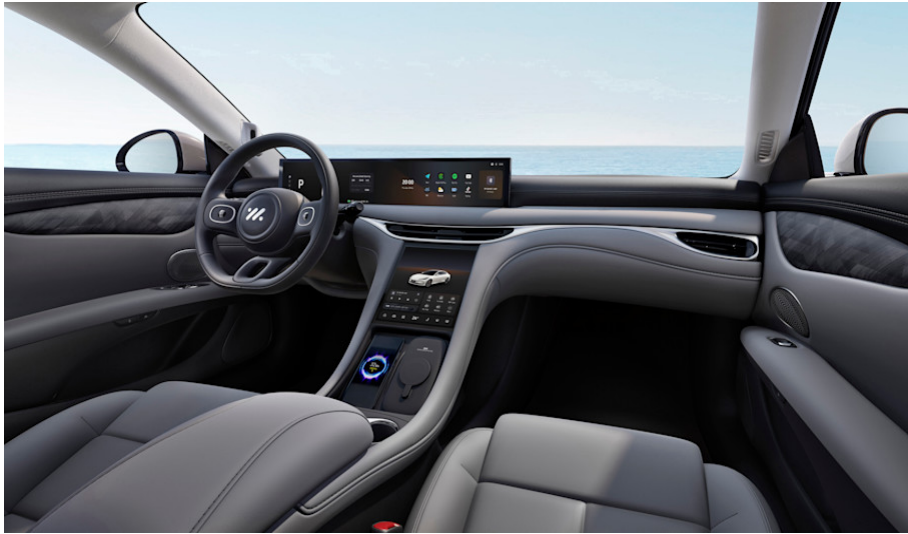
Ultrasofte Sitze in Lederoptik – Grau