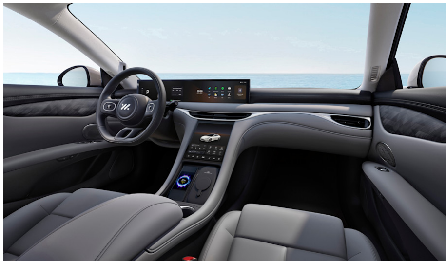
Sedili ultra morbidi in similpelle – Grigio