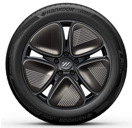
Standard 19" Aero Wheels 245/45R