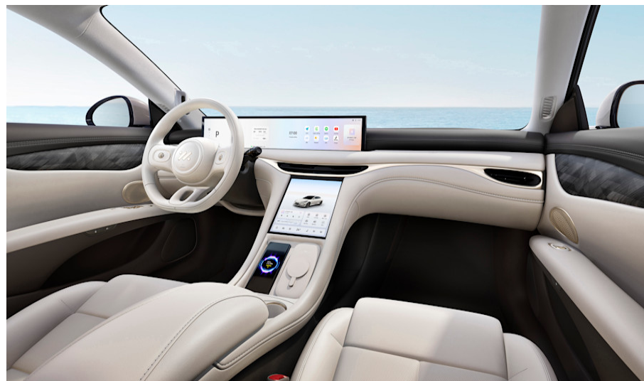
Sedili ultra morbidi in similpelle – Bianco