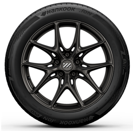
Long Range & Performance 19" Lightweight Wheels Anteriore: 245/45R19 Posteriore: 275/40R19