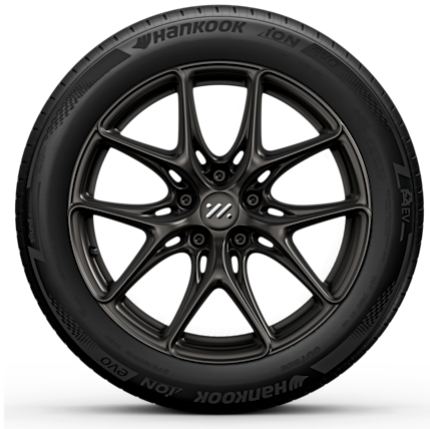
Long Range & Performance 19" Lightweight Wheels Vorne: 245/45R19 Hinten: 275/40R19