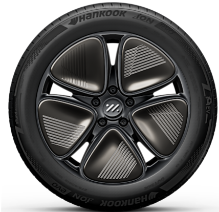
Standard 19" Aero Wheels 245/45R