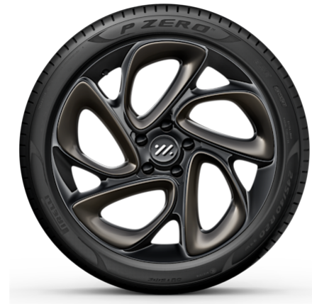
Performance 20" Sport Wheels Vorne: 245/40R20 Hinten: 275/35R20