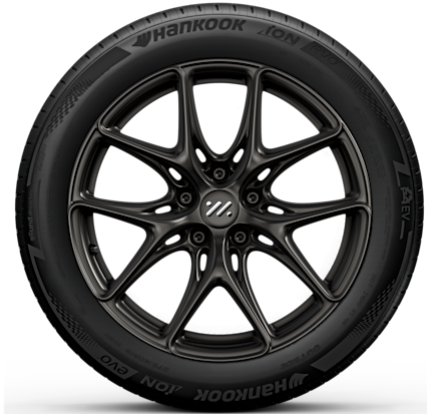
Long Range & Performance 19" Lightweight Wheels Vorne: 245/45R19 Hinten: 275/40R19