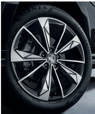
Jantes en alliage léger 19" 225/55R19