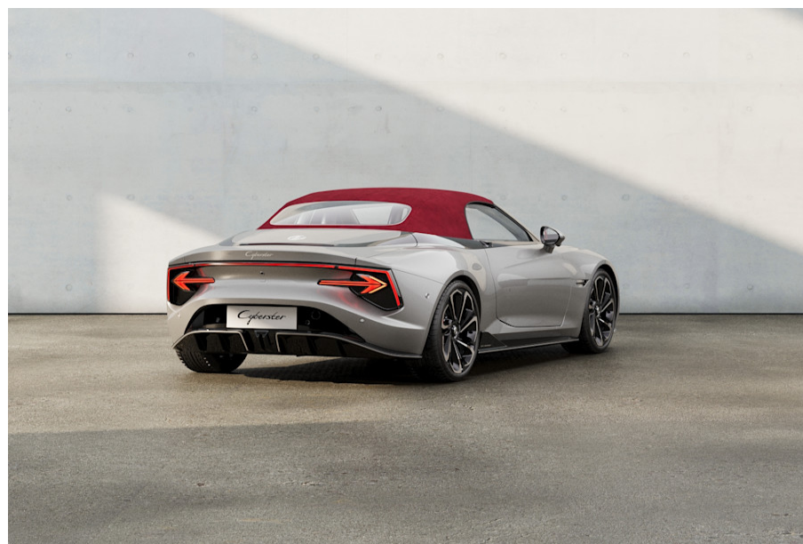
Capote in tessuto marciro