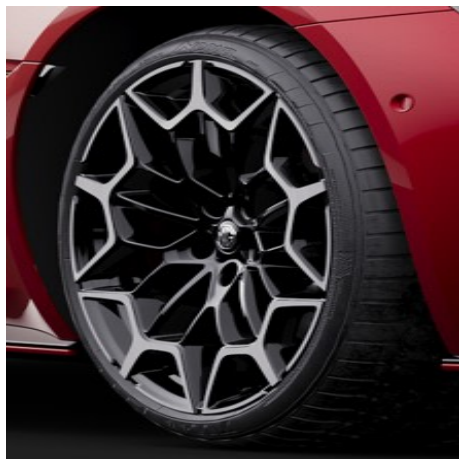
2WD Cerchi in lega leggera 19" Anteriore: 245/45R19 Posteriore: 275/40R19