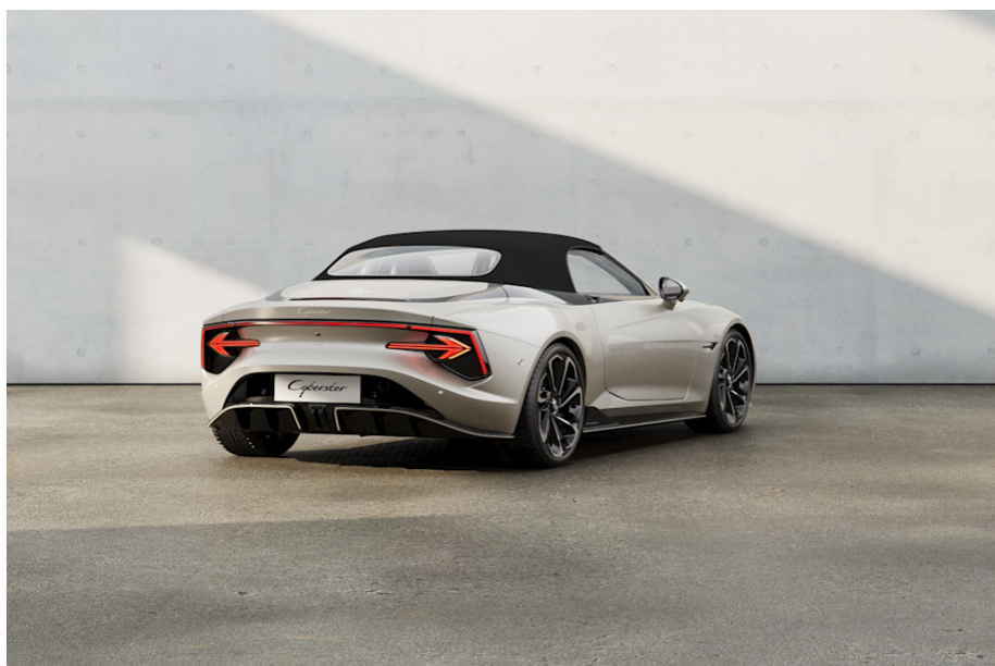
Capote in tessuto nero