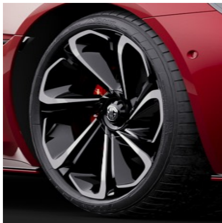
4WD Cerchi in lega leggera 20" Anteriore: 245/40R20 Posteriore: 275/35R20