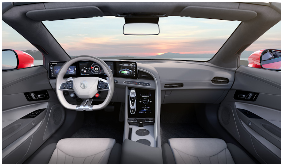
Sedili sportivi grigio