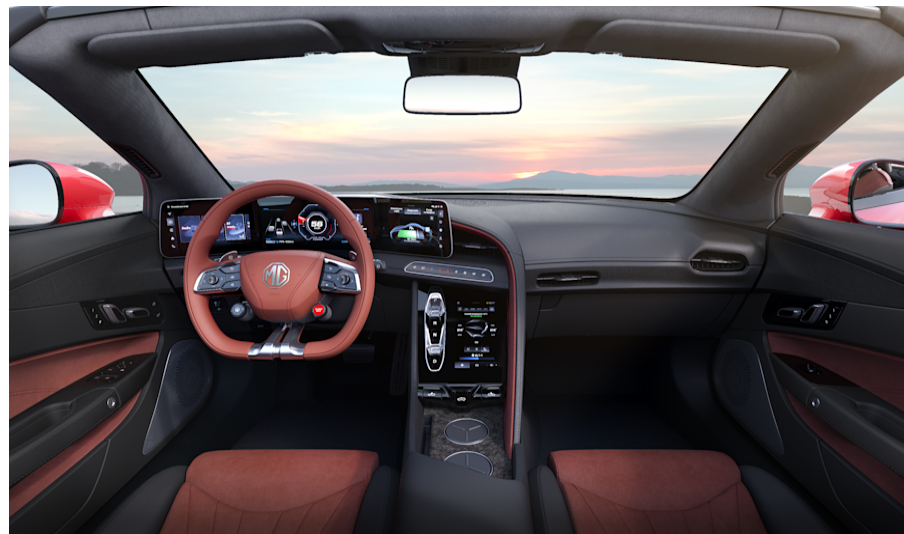
Sedili sportivi nero & rosso