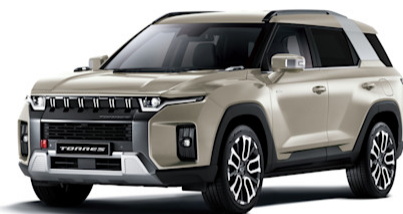
Latte Greige Metallic (EBL)