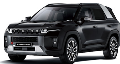
Space Black Metallic (LAK)