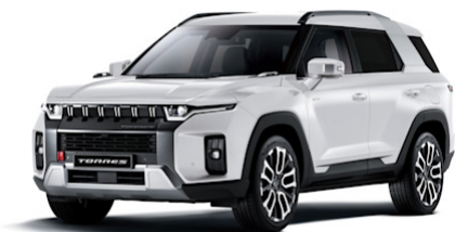
Grand White (WAA)