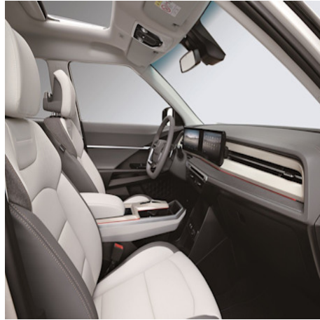
Light Grey Interior (ACE) CHF 150 (nur für Titanium)