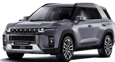
Iron Metal Metallic (ADE)