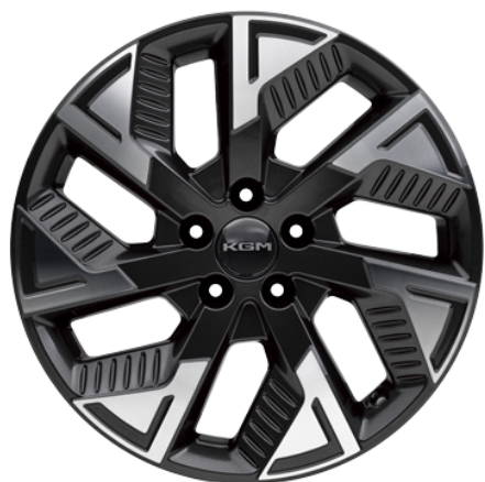
Platinum Hybrid 18"-Leichtmetallfelgen (Bereifung 225/60)