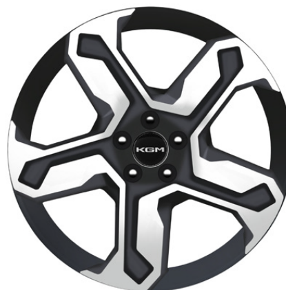
Titanium Hybrid 20"-Leichtmetallfelgen (Bereifung 245/45)