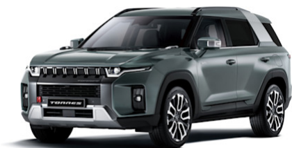
Forest Green Metallic (GAO)