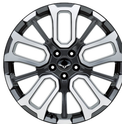
Titanium 4WD 20"-Leichtmetallfelgen "Diamond Cut" (Bereifung 245/45)