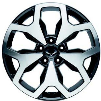
Platinum 4WD 18"-Leichtmetallfelgen (Bereifung 235/55)