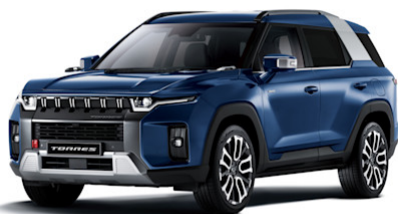
Dandy Blue Metallic (BAS)