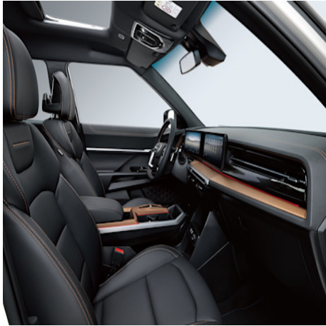
Black Interior (LBH)