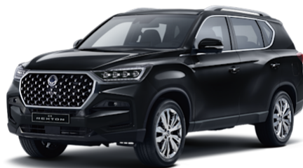
Space Black Metallic (LAK)