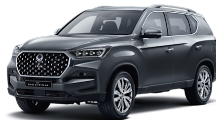
Marble Grey Metallic (ACM) nur ab Lager