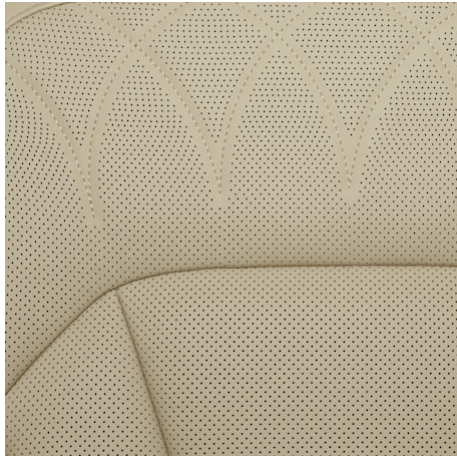
Titanium Echt-Leder-Sitze nur in Verbindung mit dem Titanium+- Paket