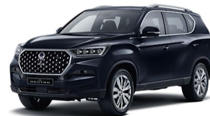
Galaxies Grey Metallic (ADB)