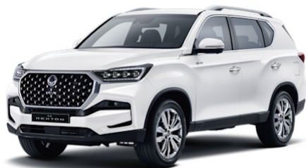
Grand White Solid (WAA)