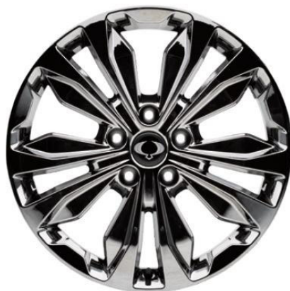
Titanium mit Titanium+-Paket 20"-Leichtmetallfelgen „Sputtering“ mit Pneu 255/50 R20