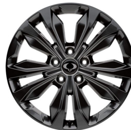
Blackline 20"-Leichtmetallfelgen „Blackline“ mit Pneu 255/50 R20