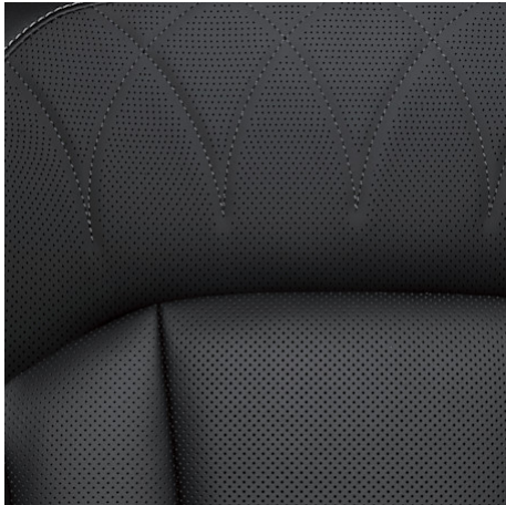
Titanium, Blackline Echt-Leder-Sitze Titanium: nur in Verbindung mit dem Titanium+-Paket