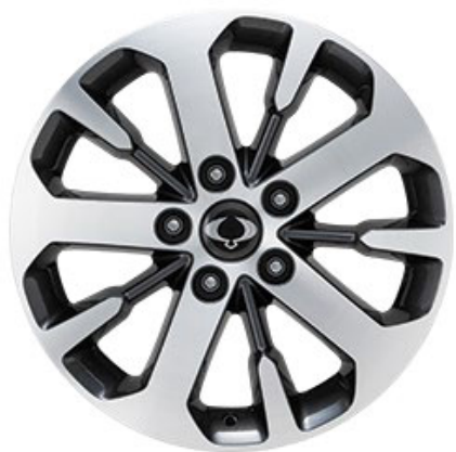
Platinum, Titanium 18"-Leichtmetallfelgen „Diamond Cut“ mit Pneu 255/60 R18