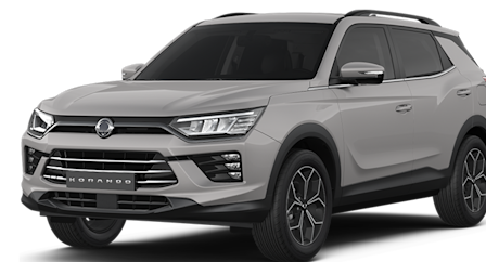
Latte Greige Metallic (EBL)