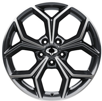
18"-Leichtmetallfelgen mit Reifen der Grösse 235/55 R18