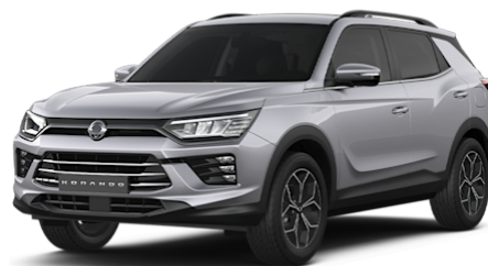
Iron Metal Metallic (ADE) nur ab Lager