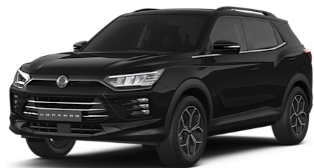
Space Black Metallic (LAK)