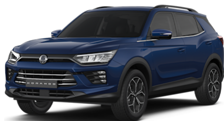
Dandy Blue Metallic (BAS)