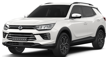
Grand White (WAA)