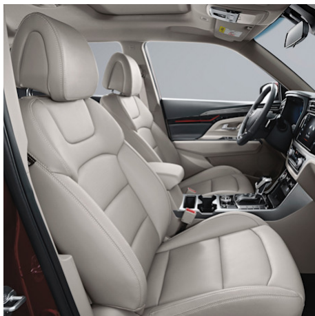
Interieur Grau / Beige (CHF 500)