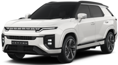
Grand White (2WA)