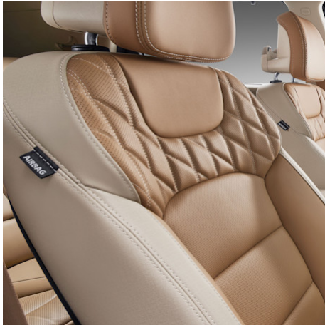
Camel & Beige (EBO) CHF 300 (nur für Titanium 4WD)