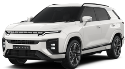
Grand White (WAA)