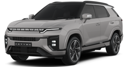
Latte Greige Metallic (2BU)