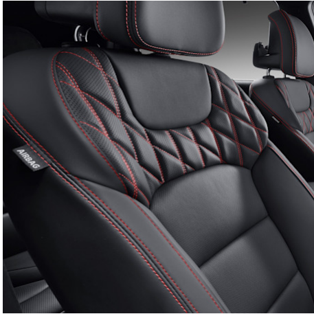
Charcoal Black (LBH)