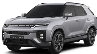
Iron Metal Metallic (ADE)