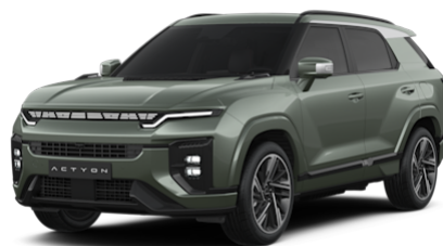
Forest Green Metallic (GAO)