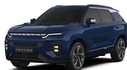
Dandy Blue Metallic (BAS)