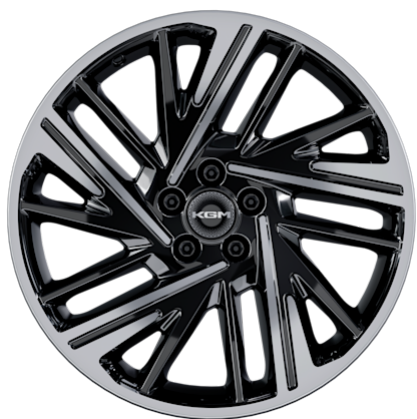
20"-Leichtmetallfelgen mit Reifen 245/45R