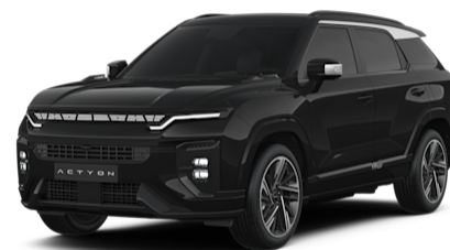
Space Black Metallic (LAK)