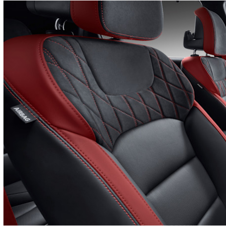
Black Suede & Red Point (LCX) CHF 400 (nur für Titanium 4WD)