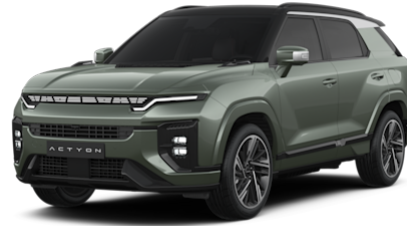
Forest Green Metallic (2GO)