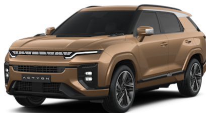
Royal Copper Metallic (OBE) nur ab Lager