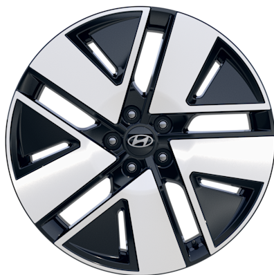
Optional (Vertex®) 20" Leichtmetallfelgen 275/50 R20