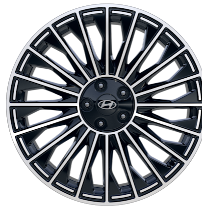
Vertex® Calligraphy 21" Leichtmetallfelgen 285/45 R21