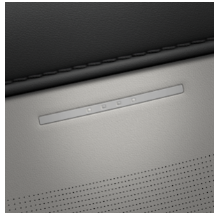
Vertex® Ledersitze schwarz-grau