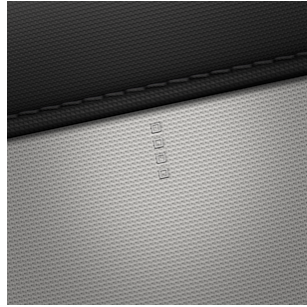
Amplia® Stoffsitze in grau