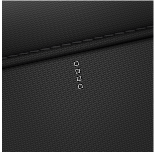
Amplia® Stoffsitze in schwarz