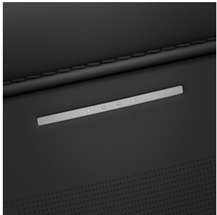
Vertex® Ledersitze in schwarz