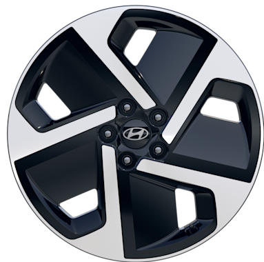
Amplia®, Vertex® 19" Leichtmetallfelgen 255/60 R19