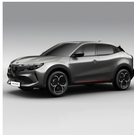
5CE 519 Grigio Arese