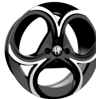
18" FORI-Leichtmetallfelgen (215/55 R18)