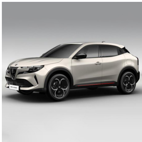
3YS 636 Avorio Galleria