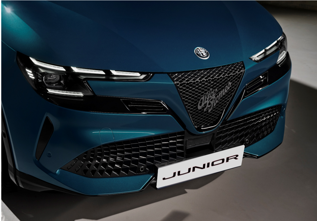
Scudetto (V-Grill) "Leggenda"