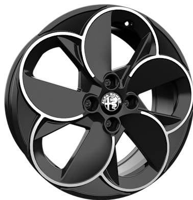
18" PETALI-Leichtmetallfelgen (215/55 R18)