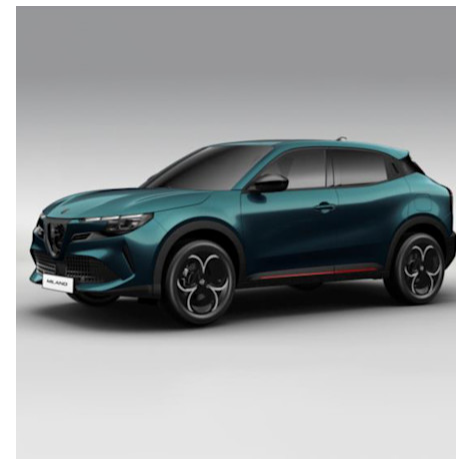
52U 688 Blu Navigli