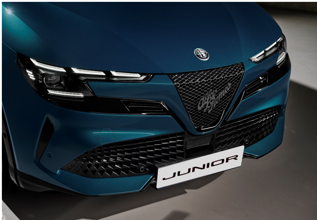
Scudetto (V-Grill) "Leggenda"

Es zeichnet sich durch ein dunkles Design mit matten digitalen Details aus und ist eine Hommage an die legendären Fahrzeuge von Alfa Romeo.