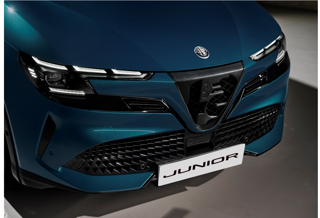
Scudetto (V-Grill) "Progresso"

Es zeichnet sich durch ein dunkles Design mit matten digitalen Details aus und ist eine Hommage an die legendären Fahrzeuge von Alfa Romeo.