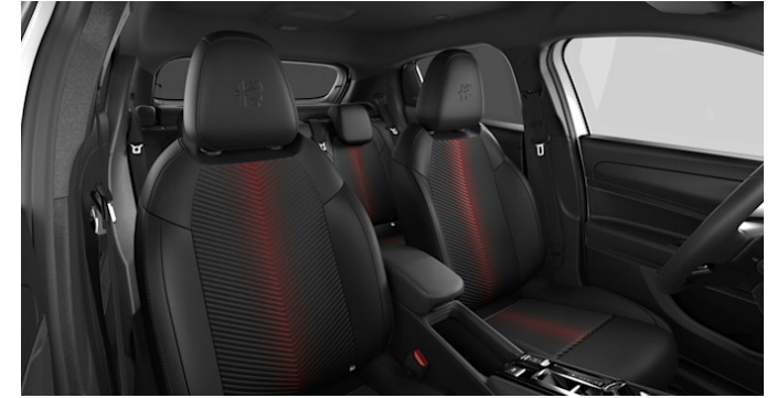
070 - SPIGA

Stoffsitze Schwarz/Blau „Biscione“ mit grauen Nähten, beheizbar, mit manueller Verstellung 6-fach (Fahrer) / 4-fach (Beifahrer)