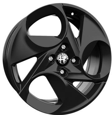
17" TURBINA-Leichtmetallfelgen (215/60 R17)