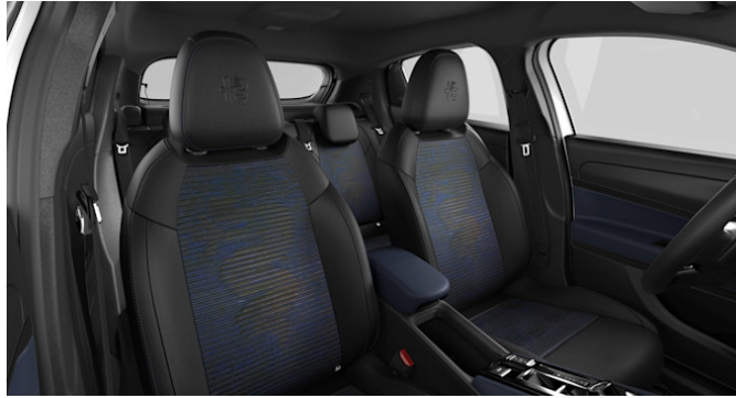
690 - ICONA heated

Stoffsitze Schwarz/Blau „Biscione“ mit grauen Nähten, mit manueller Verstellung 6-fach (Fahrer) / 4-fach (Beifahrer)