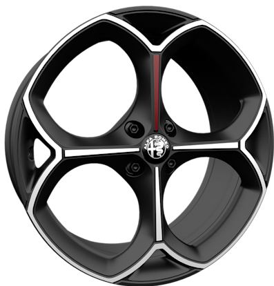
20" VENTI-Leichtmetallfelgen (225/40 R20) Michelin Pilot Sport EV