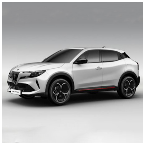
5CA 268 Bianco Sempione