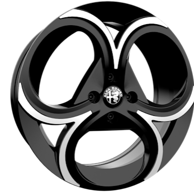
18" FORI-Leichtmetallfelgen (215/55 R18)