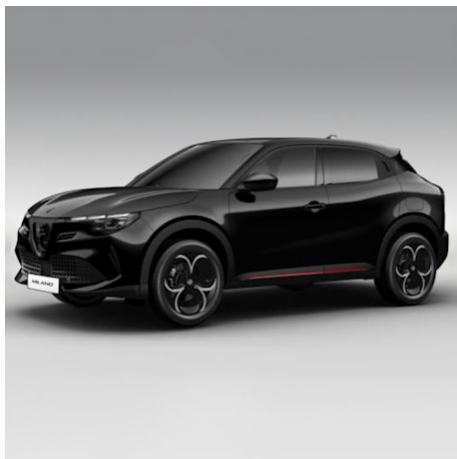
5DL 601 Nero Tortona