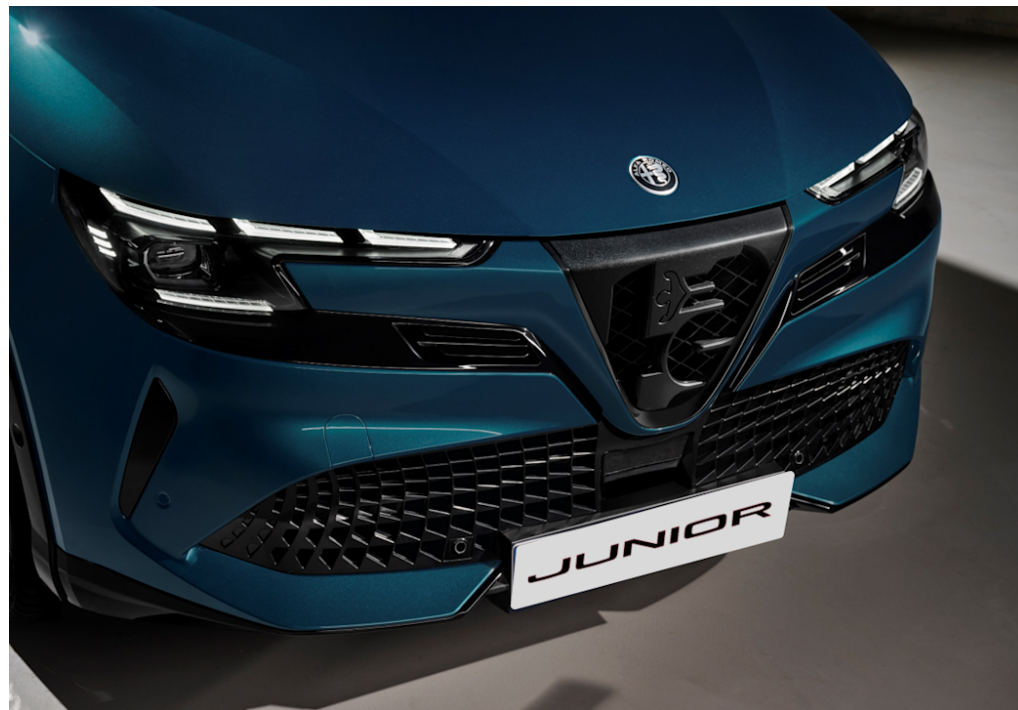
Scudetto (V-Grill) "Progresso"

Es zeichnet sich durch ein dunkles Design mit matten digitalen Details aus und ist eine Hommage an die legendären Fahrzeuge von Alfa Romeo.