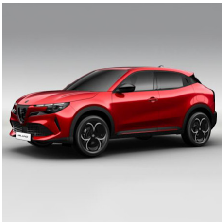
58Z 136 Rosso Brera